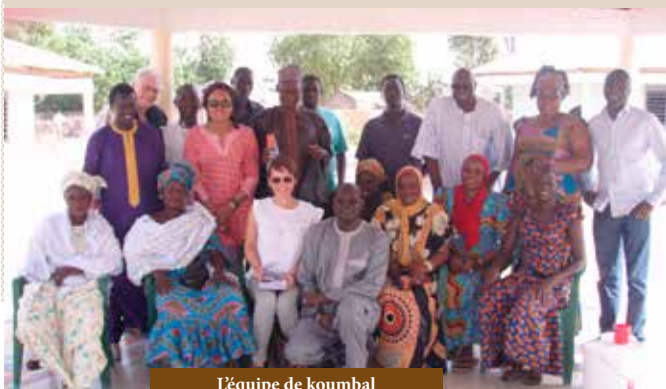
L'équipe de Koumbal

Aujourd'hui, près de 800 enfants, répartis dans 9 maternelles, sont scolarisés chaque année grâce à RACINES D'ENFANCE .