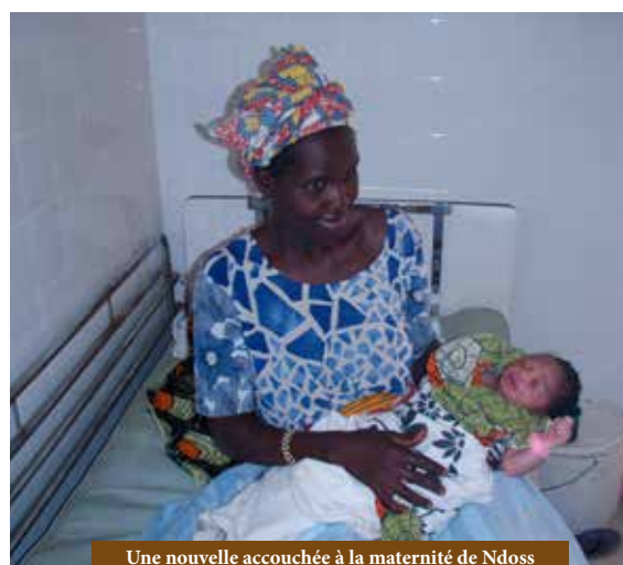
Une nouvelle accouchée à la maternité de Ndoss