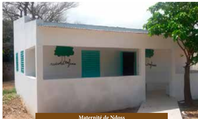
Maternité de Ndoss

Elles sont effectuées par des médecins sénégalais en coordination avec les structures sanitaires des villages (infirmières ou agents de santé). A l'issue de cette visite, un livret médical est délivré à chaque enfant. Un compte-rendu de chaque visite est rédigé par le médecin et adressé conjointement à l'association et aux autorités sanitaires locales.