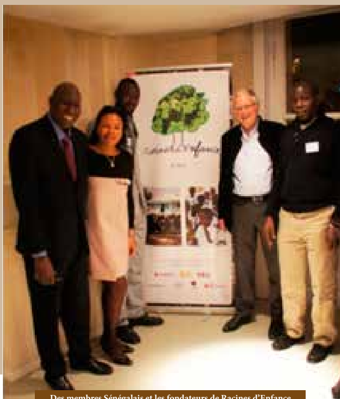
Des membres Sénégalais et les fondateurs de Racines d'Enfance

2017 : Réfection des salles de classes de Saal et Koar. Réfection des classes de CP et CEI du village de Keur Assan.