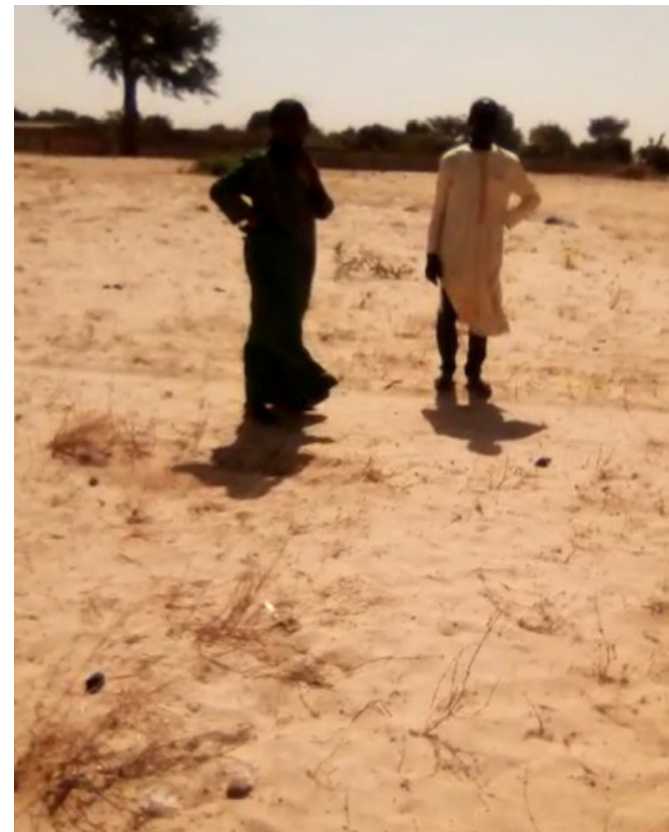
Le directeur de l'association parent d'élèves et la directrice de l'école primaire Fama Diop